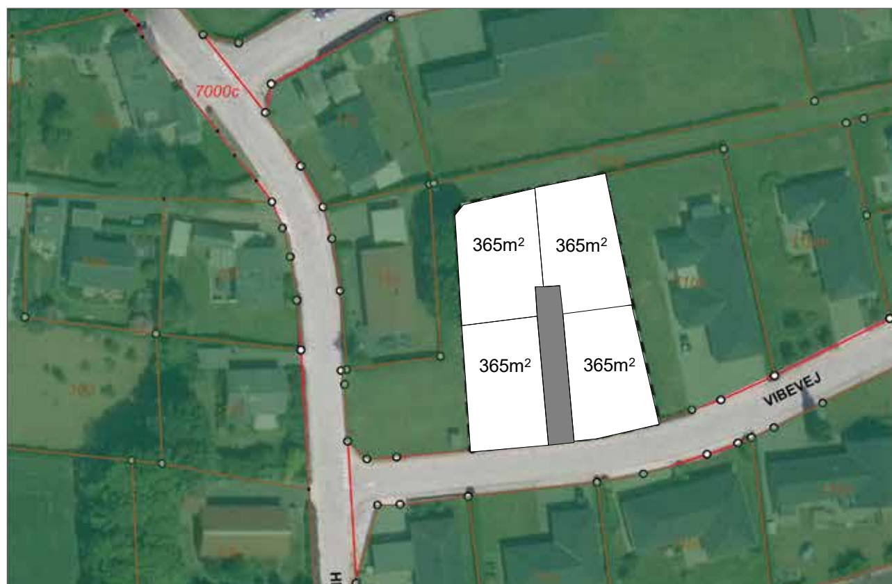
Udstykningsprincip for anvendelse til tæt-lav boligbebyggelse.