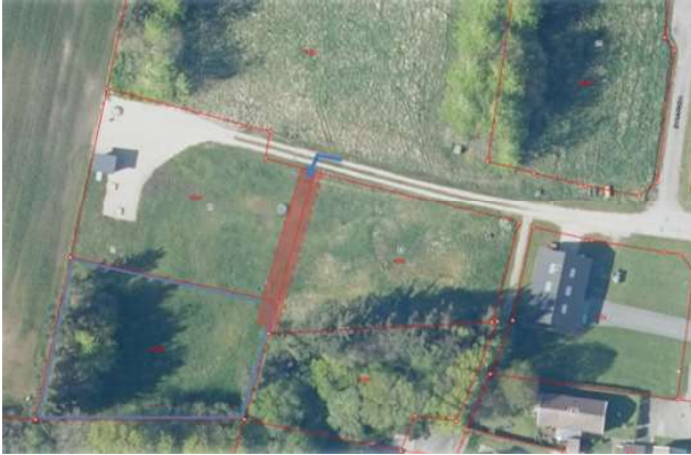
Bilag 3: Adgang til matriklen