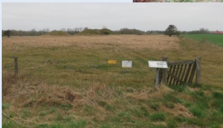
Kulturen til forskel